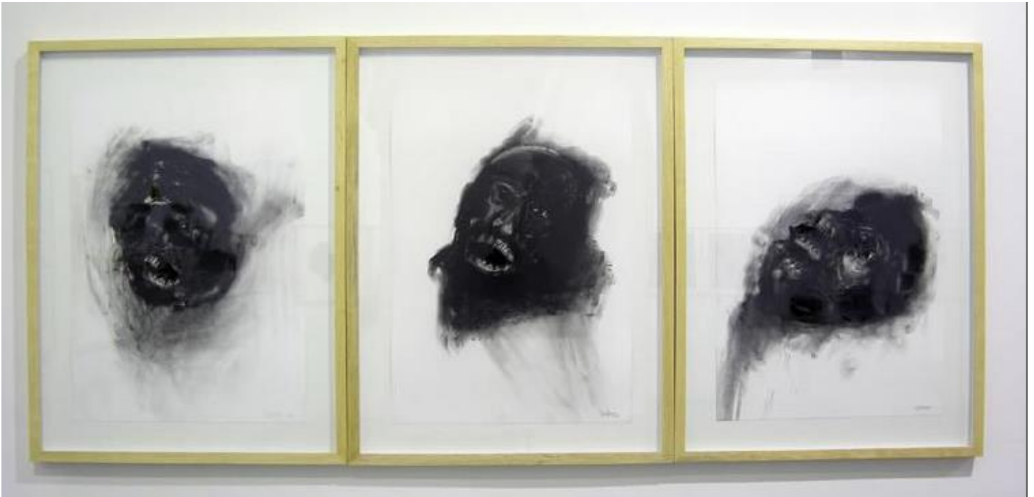
De la serie "Si los perros Hablaran"

Dibujo Sobre Papel técnica mixta (Lápiz, Carboncillo, esfero)